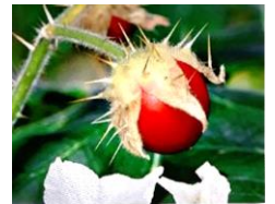
Litschi-Tomaten schmecken wie Kirschen

Der „L(i)ebenswerte“ Pflanzmarkt findet auch heuer wieder unter Coronabedingungen am Sonntag, 16. Mai von 9-12 Uhr vor dem Museum Gerstlhaus, Markt 18, bei ungünstigem Wetter im alten Feuerwehrdepot auf dem Marktplatz, Markt 1 statt. Gemüse-, Kräuter- und Zierpflanzler, Beerensträucher und Gartenstauden, Samen und Tipps warten auf liebevolle Hobbygärtner. Falls es die Pandemiemaßnahmen erlauben, wird das Krämereimuseum geöffnet sein, und es können dort Arbeiten aus der Lebenswelt bewundert und erworben werden.