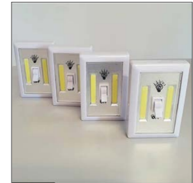
LED-Wandlicht Kippschalter 4er-Set

Die LED-Lichter eignen sich ideal als Notbeleuchtung und sollten in jedem Raum angebracht sein. Sie sind auch praktisch für den täglichen Gebrauch, dort wo keine Stromversorgung zur Verfügung steht (Schrankbeleuchtung). Die Designauswahl ermöglicht eine Anpassung ans jeweilige Raumkonzept. Die Befestigung ist mit Klebestreifen, Magnetfuß oder Schraubenloch möglich. Bei allen Wandlichtern sind Batterien im Lieferumfang enthalten.