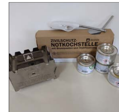
Brennpaste für Notkochstelle